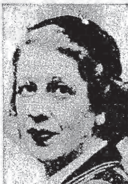
Princess Elena in 1948.

The marriage brought on him the strong displeasure of his parents and was subsequently dissolved. In 1921 he married Helen, eldest daughter of Constantine, later King of Hellenes, and a son of Prince Michael, was born to them. But the marriage did not prosper and in 1925 Carol, who had resumed an association with Magda Lupescu (by now married and