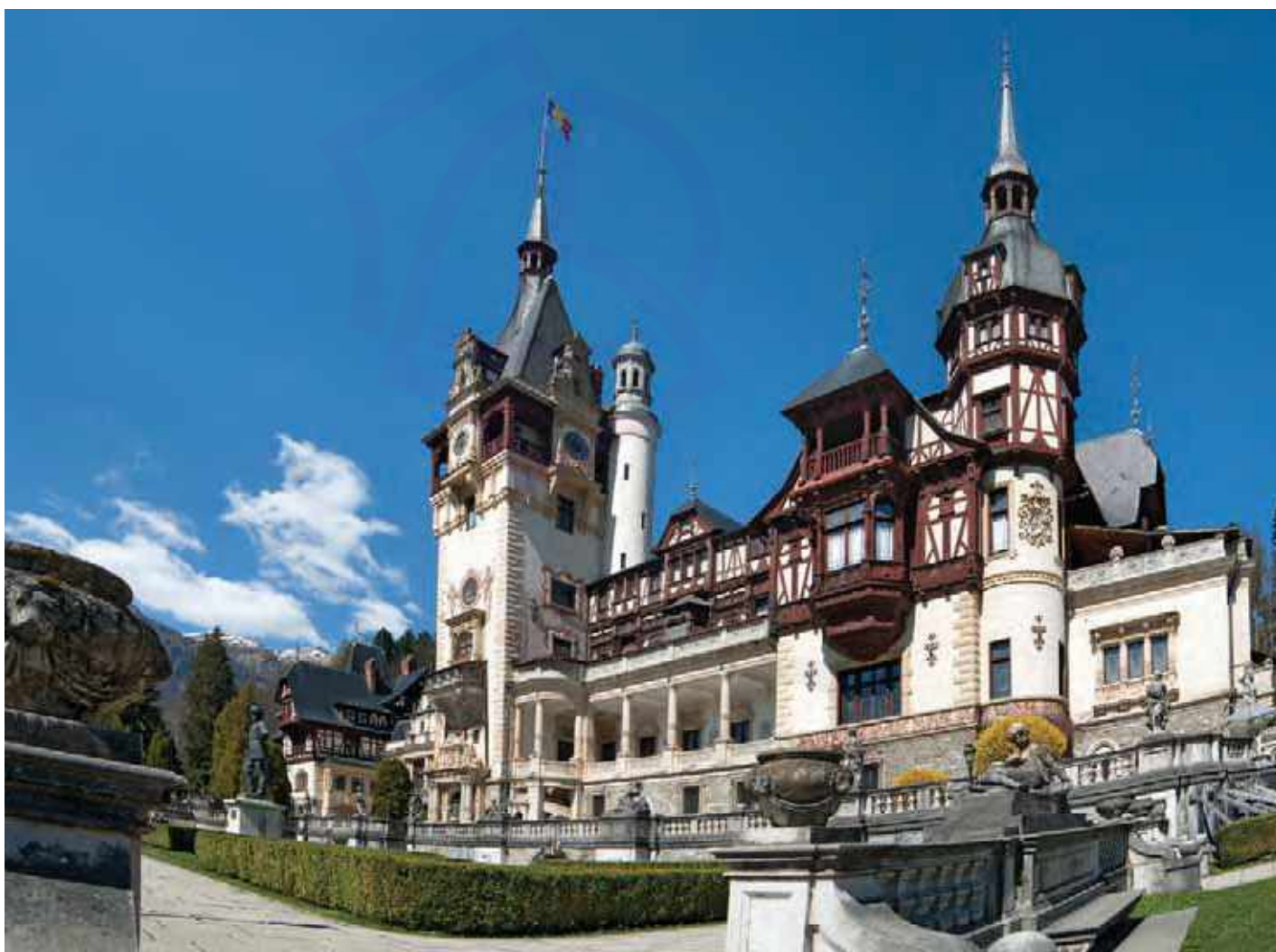
Castelul Peleş, vedere generală.